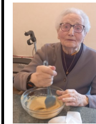
Vive les rois !