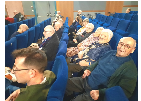
Cinéma à Saint-Macaire « Comme par magie »