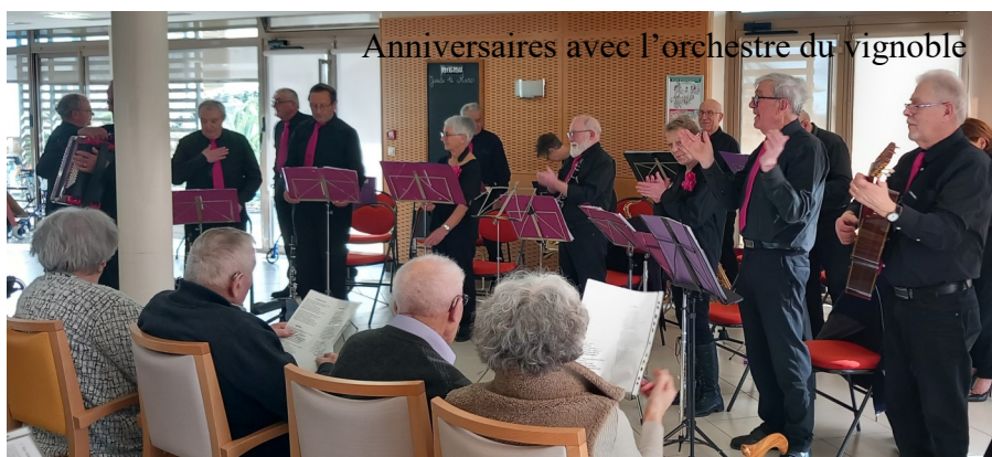
Anniversaires avec l'orchestre du vignoble