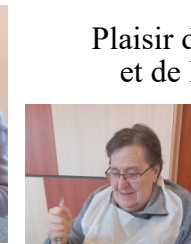
Vive les reines !