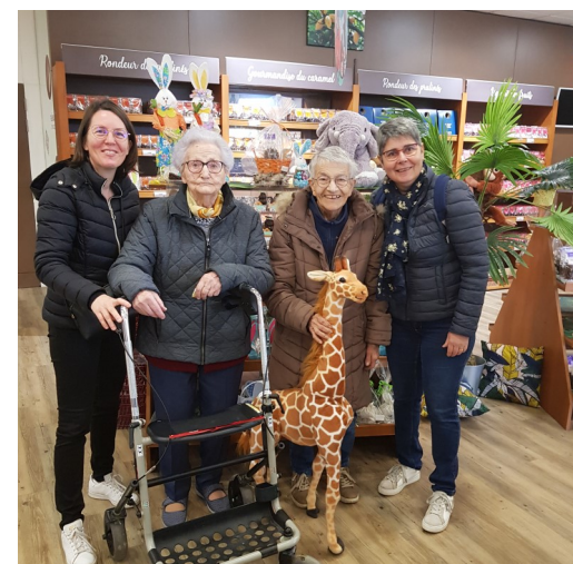
Visites avec les ASG d'une chocolaterie et d'une jardinerie