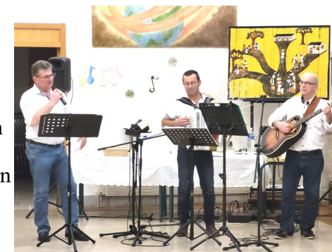
Thé dansant avec les EHPAD du Longeron et de Saint-Germain