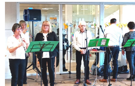
Bal au Clair Logis du Longeron