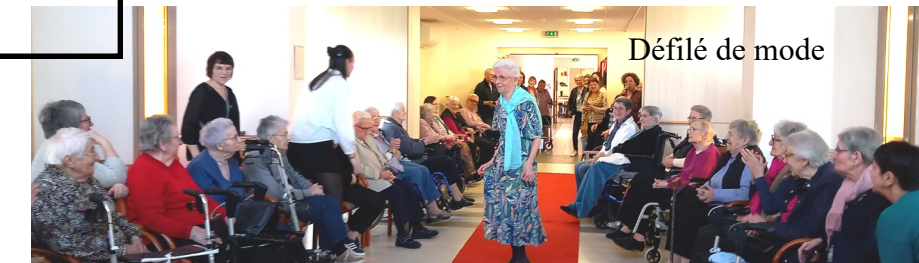
Défilé de mode