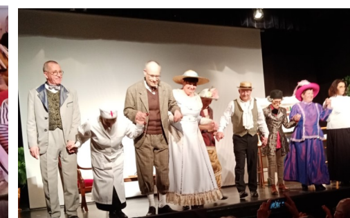
Théâtre de Torfou pour la pièce « 600000 F par jour ».