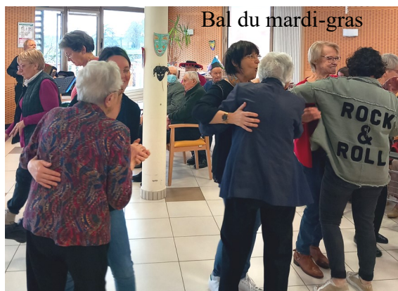
Bal du mardi-gras