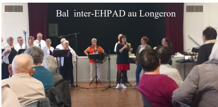
Bal inter-EHPAD au Longeron