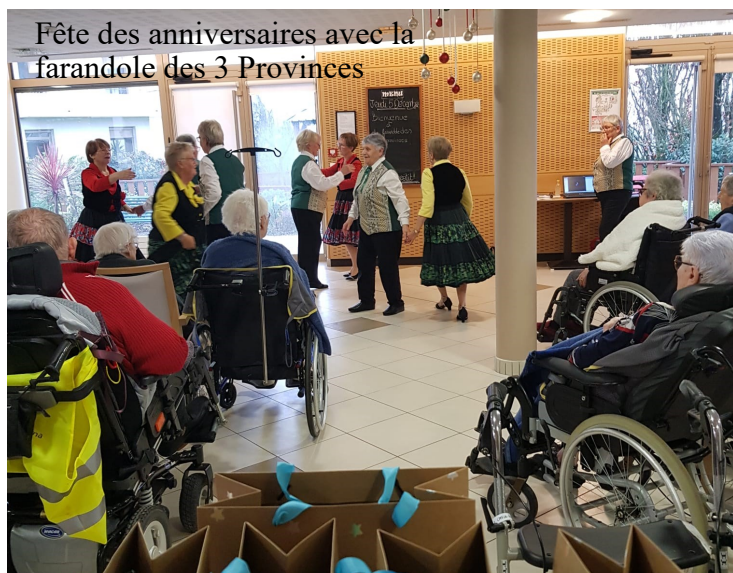
Fête des anniversaires avec la farandole des 3 Provinces