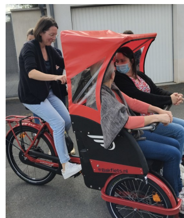
Le vélo-cargo est en rodage.