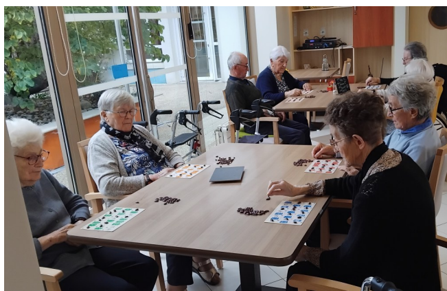
Nos lotos et les heureux gagnants