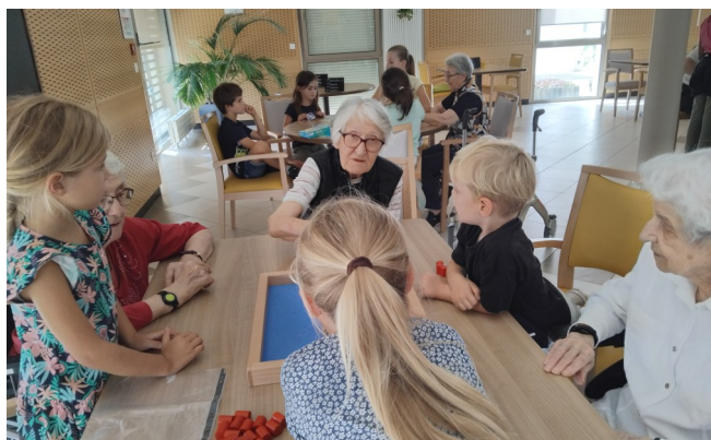
Avec les enfants du Centre de Loisirs