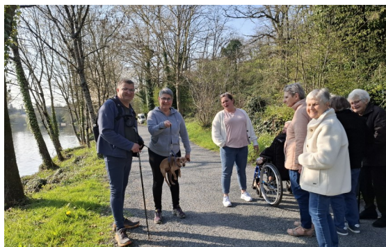
Balade au Foulon,