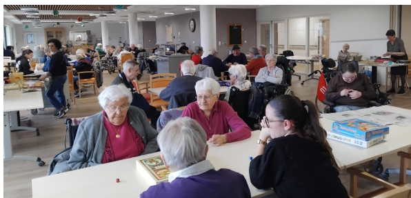
En février, on a fait sauter les crêpes à l'EHPAD du Longeron