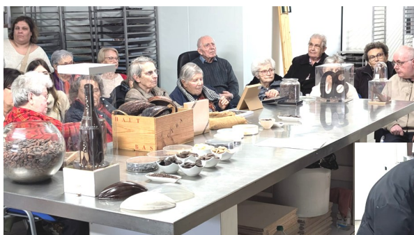
Chocolaterie des Herbiers