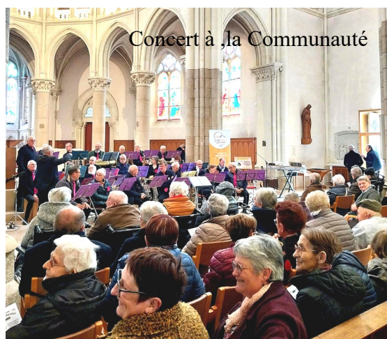
Concert à la Communauté

Les résidents ont suivi avec atten- tion, le processus de fabrication. La dégustation a été bien appréciée.